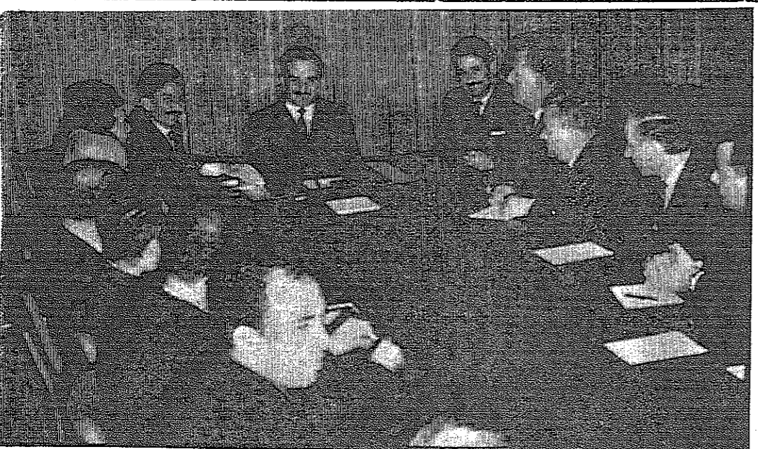
جلالة الملك المعظم والي نيته السيد صلاح أبو زيد وزير الإعلام أثناء زيارة جلالة الوزارة واجتماعه برؤساء الأقسام ومدراء الدوائر التابعة لها

الأحد في ٢٥ رمضان سنة ١٣٨٨ هـ الموافق ١٥ كانون الأول سنة ١٩٦٨ م رقم العدد ٦٠٧